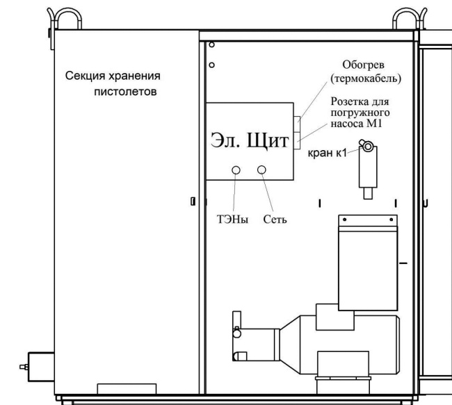
Схема расположения пункта мойки колёс